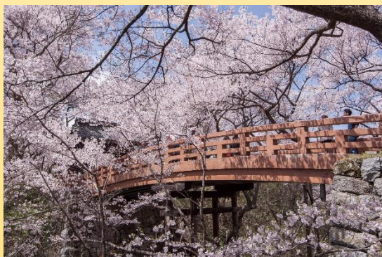
高遠城址公園「桜雲橋」

2006年に合併した高遠町の高遠城址公園は、「天下第一の桜」と称されるタカトオコヒガンザクラの名所で、春になると毎年多くの人を訪れます。